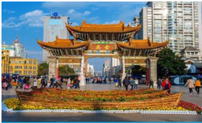
ซุ้มประตูโบราณ ม้าทอง ไค่หยก

หลังจากเที่ยวชมภูเขาสีแดงแล้ว นำท่านเดินทางกลับเมืองคุนหมิง (ระยะทาง 159 กม.ใช้เวลาเดินทางโดยรถบัสราว 2 ชั่วโมงเศษ)