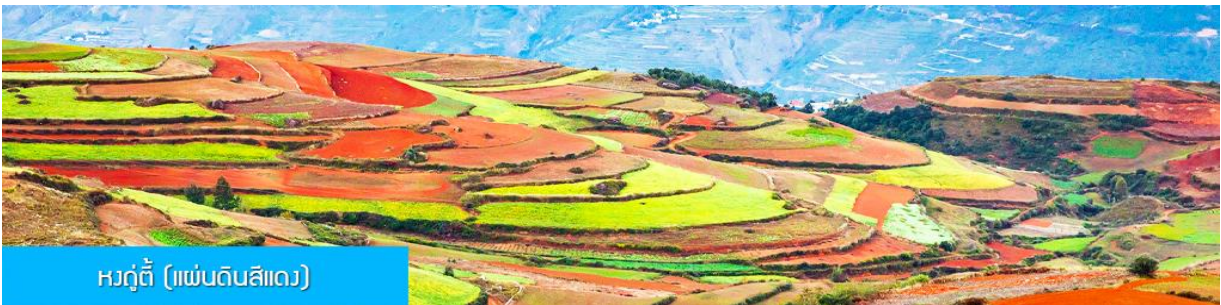
หวงตูตี้ (แผ่นดินสีแดง)

หลังอาหารเช้าท่านเดินทางสู่ เมืองตงชวาน 东川红土地 ซึ่งเป็นที่ตั้งของ หวงตูตี้ (แผ่นดินสีแดง) นำท่าน ชม แผ่นดินสีแดง อันเป็นลักษณะภูมิประเทศที่เป็นภูเขาที่สลับซับซ้อนที่กว้างใหญ่ มีนาขั้นบันไดและการ