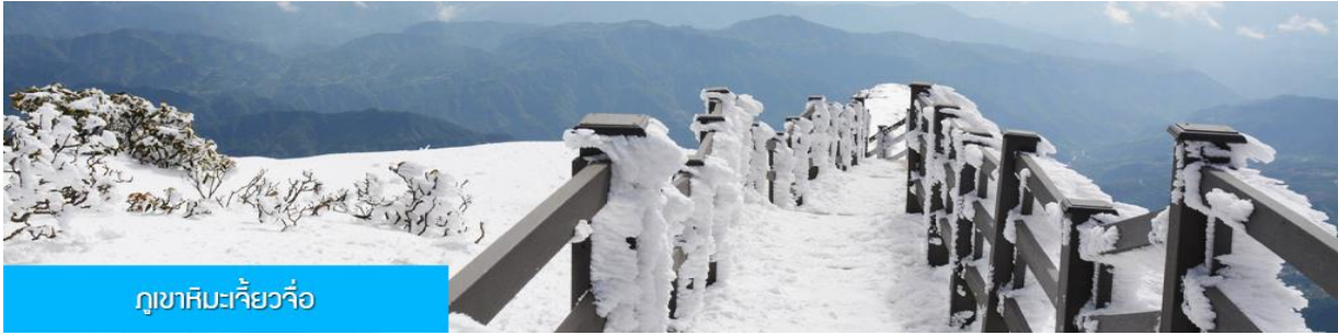
ภูเขาหิมะเจี้ยวจื่อ

วันที่สอง เมืองถ่างเตี้ยน – ภูเขาหิมะเจี้ยวจื่อ – ชมแผ่นดินสีแดงตงฉวน-เมืองคุนหมิง – ถนนคนเดิน หนานผิงเจีย – ร้าน POP MART