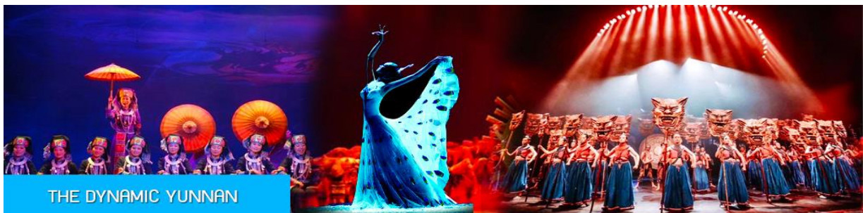
THE DYNAMIC YUNNAN

รับประทานอาหารค่ำ ณ ภัตตาคาร **สุกี้เห็ด