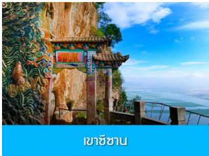
เขาชี้ซาน

โปรแกรมท่องเที่ยวที่ท่านเลือกซื้อเป็น โปรแกรมราคาโปร โมชั่น บริษัทท่องเที่ยวท้องถิ่นมิน โนบายให้ไกด์ท้องถิ่นนำเสนอโปรแกรมทัวร์เสริม OPTIONAL TOUR ที่ไม่ได้รวมอยู่ในโปรแกรมทัวร์ การจะซื้อหรือไม่ นั้นขึ้นอยู่กับการตัดสินใจของลูกค้าทัวร์