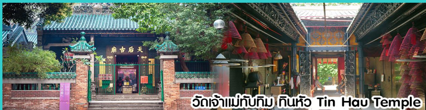
วัดเจ้าแม่ทับทิม ทินหัว Tin Hau Temple

นำทุกท่าน ไหว้ศาลเจ้าแม่ทับทิม ทินหัว (Tin Hau Temple) เป็นวัดเก่าแก่และสำคัญอีกวัดหนึ่งของฮ่องกง เพราะในสมัยก่อนฮ่องกงเป็นเพียงหมู่บ้านชาวประมง ซึ่งเคารพนับถือเจ้าแม่ทับทิมว่าเป็นเทพีแห่งทะเล เพื่อให้เดินทางปลอดภัย เวลาออกไปทำงานไกล ๆ หรือออกหาปลา นอกจากการมาสักการะบูชาเจ้าแม่ทับทิมในเรื่องของการเดินทางให้ปลอดภัยแล้ว ไฮไลท์สำคัญอีกอย่างหนึ่งของ วัดเจ้าแม่ทับทิม ทินหัว (Tin Hau Temple) จะเป็นขดรูปสีแดงขนาดใหญ่ ที่แขวนอยู่ตามเพดานด้านในวิหารของวัดเต็มไปหมด จะยิ่งสวยงามในยามที่มีแสงแดงส่องลงมาเหมือนเป็นลำแสงส่องทะลุวันรูปแปลกตายิ่งนัก ส่วนอาคารของวัดก็จะเป็นสถาปัตยกรรมแบบวัดจีน สร้างขึ้นตั้งแต่ปีค.ศ. 1876 โดยทางเข้าของวัดจะอยู่ติดกับสวนสาธารณะเล็กๆ ที่มีต้นไม้ใหญ่หลายต้น ให้บรรยากาศร่มรื่น