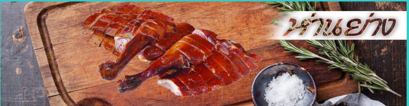
ร้านแย่าง

นำท่านขอพร วัดแขกหมิว หรือ วัดกั๊กหันนำโชค วัดนี้ตั้งอยู่ที่ตำบลซาทัน ซึ่งถือเป็นชานเมืองของฮ่องกง เป็นวัดเก่าแก่ของฮ่องกง สร้างขึ้นเมื่อ 400 กว่าปีผ่านมาแล้วในสมัยราชวงศ์ซิง ขึ้นชื่อลือชาในเรื่องความศักดิ์สิทธิ์ในด้านของโชคลาภ ทรัพย์สินเงินทอง โดยมีรูปปั้นเจ้าพ่อแขก และดาบไร้พ่ายเป็นสิ่งศักดิ์สิทธิ์ประจำวัด ตำนานเล่าว่าในช่วงปลายของราชวงศ์ซิง