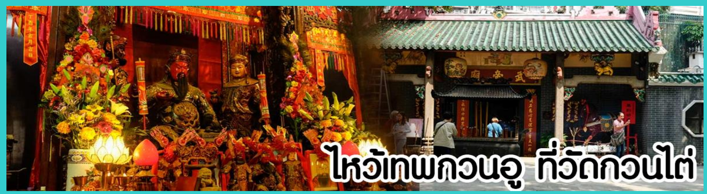
ไหว้เทพกวนอู ที่วัดกวนไต๋

หลังจากนั้นขอพรเทพเจ้ากวนอู ณ วัดกวนไต๋ วัดเก่าแก่สร้างขึ้นในปีพ.ศ. 2434 เป็นวัดเดียวในเกาะลูนที่บูชาเทพ เจ้ากวนอูเป็นเทพผู้ยิ่งใหญ่ เทพเจ้าแห่งความซื่อสัตย์ โชคลาภ บารมี