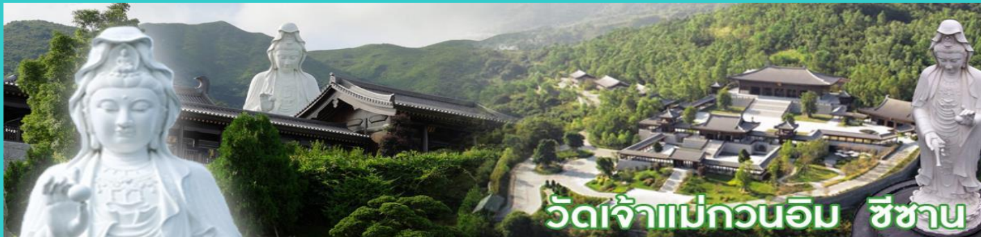
วัดเจ้าแม่กวนอิม ชีซาน

หลังจากนั้นนำคณะเดินทางสู่ วัดชีซาน หลายคนที่เคยไปเที่ยวฮ่องกงมาแล้ว อาจจะยังไม่เคยเยือนวัดชีซาน หรือ Tsz Shan Monastery เป็นวัดที่มีเจ้าแม่กวนอิมองค์ใหญ่เป็นอันดับสองของโลก มีความสูงถึง 76 เมตร ตั้งอยู่บนเนื้อที่กว่า 29 ไร่ ในเกาะฮ่องกง โดยมีนาย ลีกาซิง มหาเศรษฐีชื่อดังของฮ่องกง บริจาคเงินสร้างวัดถึง 193 ล้านบาท