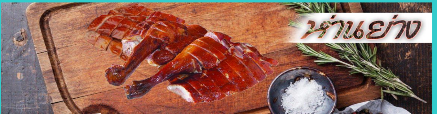
ร้านแย่าง

นำท่านขอพร วัดแขกหมิว หรือ วัดกั๊กหันนำโชค วัดนี้ตั้งอยู่ที่ตำบลชากีน ซึ่งถือเป็นชานเมืองของฮ่องกง เป็นวัดเก่าแก่ของฮ่องกง สร้างขึ้นเมื่อ 400 กว่าปีผ่านมาแล้วในสมัยราชวงศ์ชิง ขึ้นชื่อลือชาในเรื่องความศักดิ์สิทธิ์ในด้านของโชคลาภ ทรัพย์สินเงินทอง โดยมีรูปปั้นเจ้าพ่อแขก และดาบไร้พ่ายเป็นสิ่งศักดิ์สิทธิ์ประจำวัด ตำนานเล่าว่าในช่วงปลายของราชวงศ์ชิง