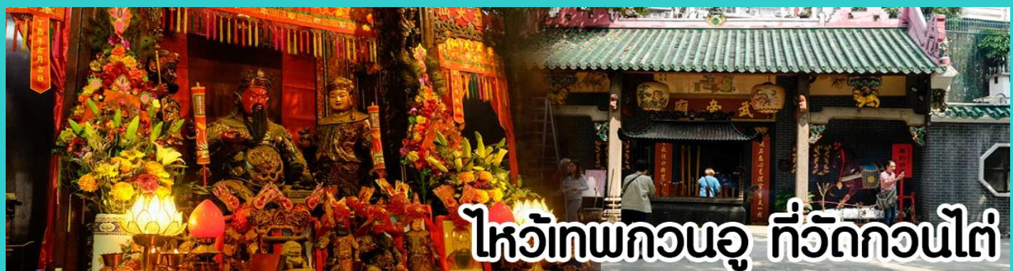
ไหว้เทพกวนอู ที่วัดกวนไต้

หลังจากนั้นขอพรเทพเจ้ากวนอู ณ วัดกวนไต้ วัดเก่าแก่สร้างขึ้นในปีพ.ศ. 2434 เป็นวัดเดียวในเกาะลูนที่บูชาเทพ เจ้ากวนอูเป็นเทพผู้ยิ่งใหญ่ เทพเจ้าแห่งความซื่อสัตย์ โชคลาภ บารมี