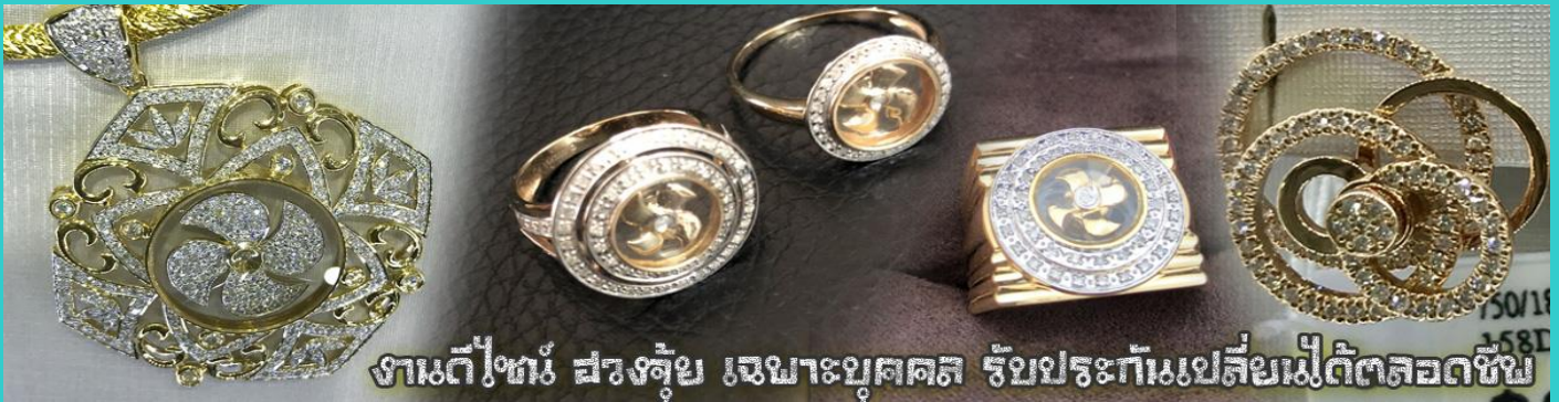
งานดีไหม? ฝรั่งชื้อ เจมาะบุคคล รับประกันแปะสี่แม่เด็ดตลอดชีพ

จะมีมากมายหลายชนิด เช่นจี้กั๊กัน แหวนรุ่นต่างๆ นาฬิกาข้อมือ (ซึ่งผู้สวมใส่จะได้รับการดูลายมือจากซินเซประจําร้าน เพื่อนำวิธีการเสริมดวงในการสวมใส่โดยไม่ติดค่าบริการ)