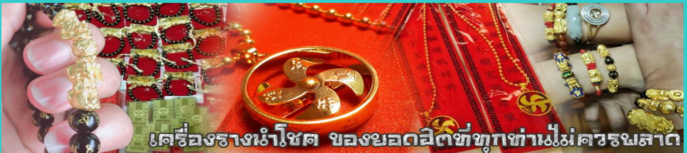
เครื่องรางนำโชค ของยอดผลิตภัณฑ์ทุกท่านไม่ธรรมดา

จากนั้นนำท่านสู่ ร้านหยก ชมความงามปีเซียะ ที่เชื่อกันว่าเป็นวัตถุมงคลยอดนิยม ที่มีการนำมาบูชา เพื่อให้ช่วยป้องกันสิ่งชั่วร้าย เรียกทรัพย์สินเงินทองให้ไหลมาเทมา และกักเก็บทรัพย์นั้นไม่ให้รั่วไหลออกไปไหนได้ ชาวจีนโบราณเชื่อกันว่า ปีเซียะเป็นสัตว์ประหลาดที่รวมลักษณะของสัตว์มงคลทั้ง 5 ชนิดไว้ด้วยกัน ได้แก่ มังกร พญาราชสีห์หรือสิงโต, อินทรี, กวาง, และแมว โดยตามตำนานเล่าว่า ปีเซียะเป็นลูกมังกรตัวที่ 9 (เทพแห่งโชคลาภ) ของพญามังกรสวรรค์ มีชื่อเรียกด้วยกันหลายชื่อไม่ว่าจะเป็น “เทียนลก (กวางสวรรค์)” เป็นชื่อเดิม ส่วนจีนกวางตุ้งจะเรียกว่า “เผ่เฮ่า” และคนจีนแต้จิ๋วจะเรียกว่า “ผีชีว”และ ยังมีจำหน่ายยาสมุนไพรบำรุงเพิ่มความแข็งแรงตามความเชื่อของคนฮ่องกง