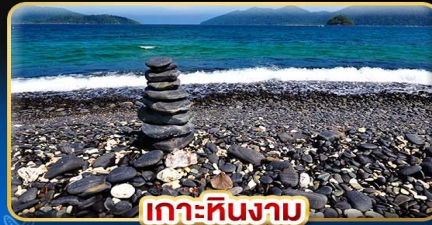
เกาะหินงาม