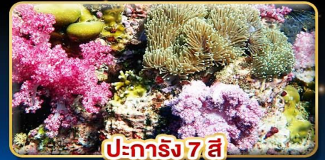
ปะการัง 7 สี