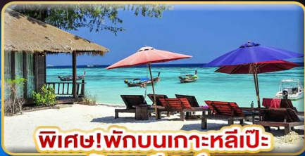
พิเศษ! พักบนเกาะหลีเป๊ะ อันคา รีสอร์ท