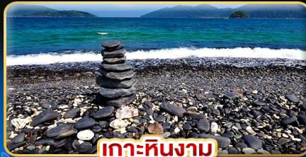
เกาะหินงาม