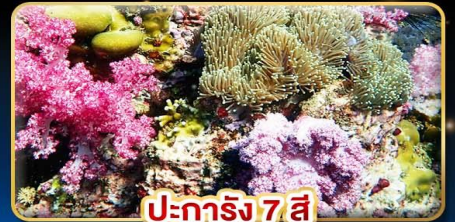
ปะการัง 7 สี