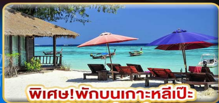
พิเศษ! พักบนเกาะหลีเป๊ะ อันดามัน รีสอร์ท

เกาะหลีเป๊ะ ทะเลสุดปัง พีเรียดสวย เทียวฟิน