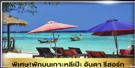
พิเศษ!พักผ่อนเกาะหลีเป๊ะ อังคาร รีสอร์ท

14,999.- ราคาเริ่มต้น 📅 เดินทาง : มี.ค.69 เป็นต้นไป