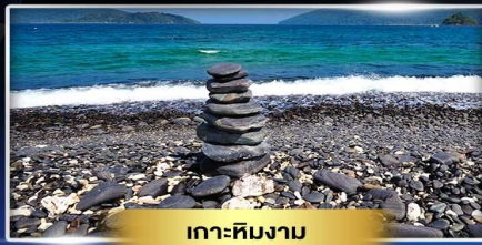
เกาะคิมงาม