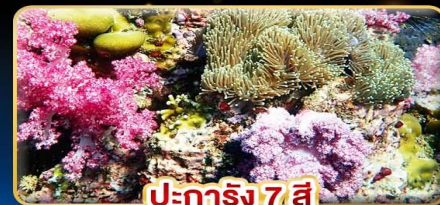
ปะการัง 7 สี