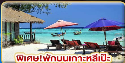
พิเศษ! พักบนเกาะหลีเป๊ะ อันดามัน รีสอร์ท