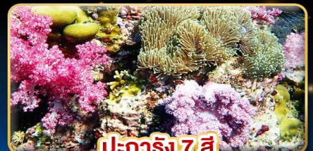
ปะการัง 7 สี