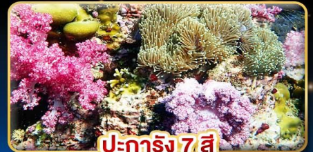
ปะการัง 7 สี