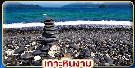
เกาะหินงาม