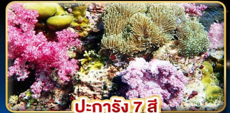
ปะการัง 7 สี