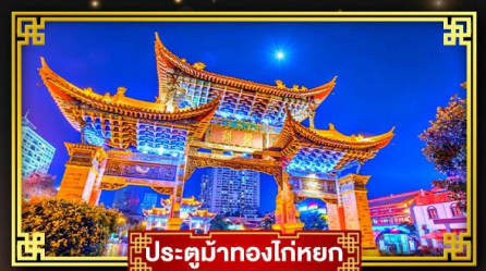
ประตูม้าทองโก่หยก