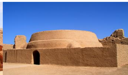
เมืองโบราณเกาซางอู๋เจี๋ย