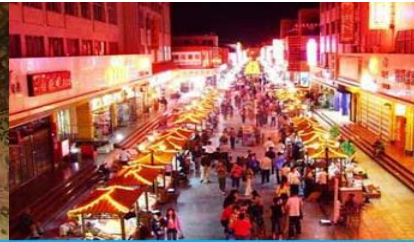
ตลาดกลางคืน ซาโจว

วันที่ 1 ด่านเจียวกวน – เดินทางสู่เมืองตุนหวง – เที่ยชมถ้ำมั่วเกา – ชมภาพยนตร์ 3 มิติ-ซาโจวในท์มาร์เก็ต