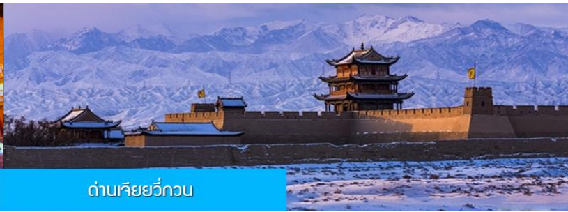
ด่านเจี๋ยวิ้วกวน