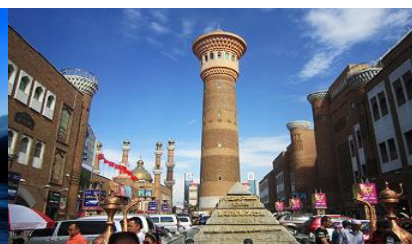
ตลาดต้าปาจา