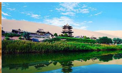
สระน้ำวงพระจันทร์