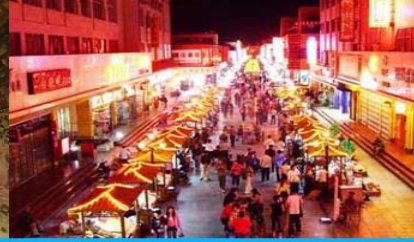
ตลาดกลางคืน ซาโจว

วันที่ 1 ด่านเจียวกวน – เดินทางสู่เมืองตุนหวง – เที่ยวชมถ้ำมั่วเกา – ชมภาพยนตร์ 3 มิติ-ซาโจวในท์มาร์เก็ต