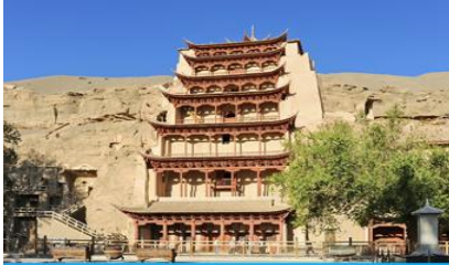
ถ้ำคินมัวเกา

พักที่ REZEN HOTEL ระดับ 4 ดาวท้องถิ่นหรือเทียบเท่าในเมือง เจียชวี่กวน