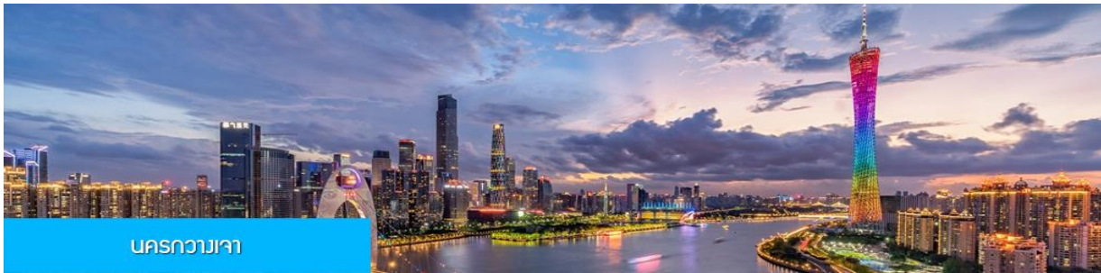
นครกวางเจา