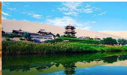
สระน้ำวพระจันทร์