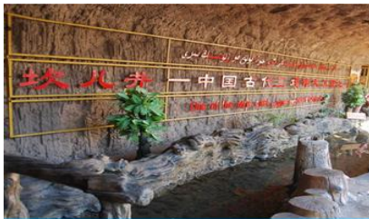
ระบบชลประทานอู๋หลู่ฟาน

พักที่ HAMPTON BY HILTON HOTEL โรงแรมระดับ 4 ดาวหรือเทียบเท่าในเมืองอู๋หลู่ฟาน