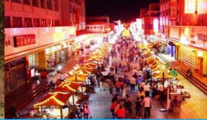
ตลาดกลางคืน ซาโจว

วันที่ 1 ด้านเจียชวี่กวน – เดินทางสู่เมืองตุนหวง – เที่ยวชมถ้ำมัวเกา – ชมภาพยนตร์ 3 มิติ-ซาโจวในท์มาร์เก็ต