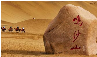
เนินทรายหมีขาซา

หลังอาหารให้ท่าน มีเวลาเดินเล่น ช้อปปิ้งใน ตลาดกลางคืน ซาโจว 沙洲夜市 ให้ท่านเลือกซื้อของที่ระลึกของเส้นทางสายไหมได้ตามอัธยาศัย