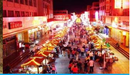
ตลาดกลางคืน ซาโจว

วันที่ 1 ด่านเจียชวีกวน – เดินทางสู่เมืองตุนหวง – เที่ยวชมถ้ำมั่วเกาถู – ชมภาพยนตร์ 3 มิติ-ซาโจวในท์ มาร์เก็ต