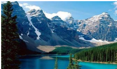
ภูเขาเทียนชาน

พักที่ MERCURE HOTEL โรงแรมระดับ 4 ดาวท้องถิ่นหรือเทียบเท่าในเมืองอูร์มุฉี