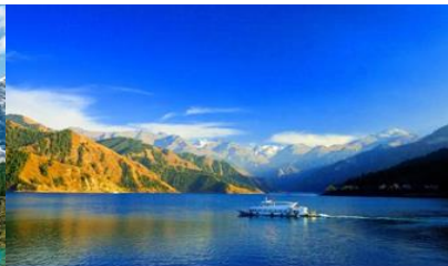
ล่องเรือทะเลสาบเทียนฉือ