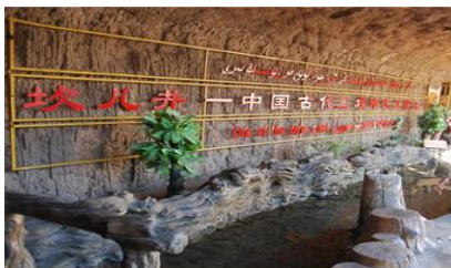
ระบบชลประทานอู๋หลู่ฟาน

พักที่ HAMPTON BY HILTON HOTEL โรงแรมระดับ 4 ดาวหรือเทียบเท่าในเมืองอู๋หลู่ฟาน