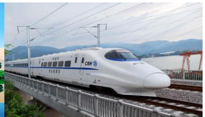
เนือรถไฟความเร็วสูง