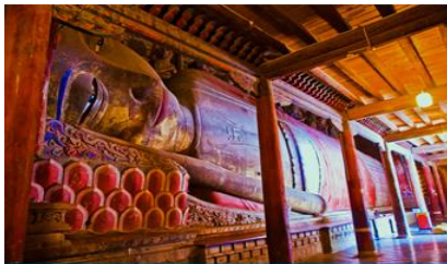
วัดพระใหญ่

พักที่ SILU QIAN XI HOTEL โรงแรมระดับ 4 ดาวท้องถิ่น หรือเทียบเท่าในเมืองจางเยี่ยน