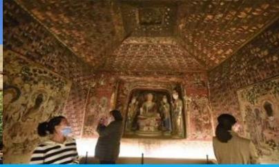
ชมภาพยนตร์ 3 มิติ