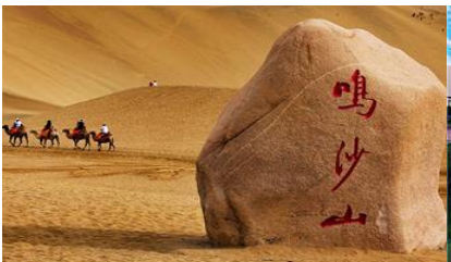
เนินทรายหมีซาซาบ

หลังอาหารให้ท่าน มีเวลาเดินเล่น ช้อปปิ้งใน ตลาดกลางคืน ซาโจว 沙洲夜市 ให้ท่านเลือกซื้อของที่ระลึกของเส้นทางสายไหมได้ตามอัธยาศัย