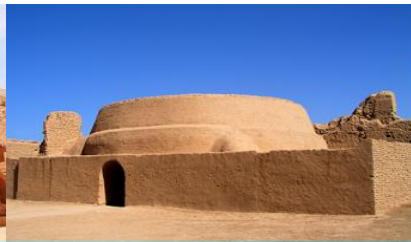
เมืองโบราณเกาซางอู๋เจี