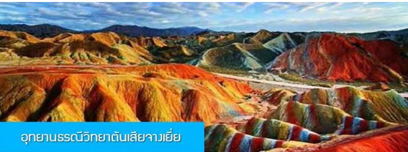
อุทยานธรณีวิทยาต้นเสี้ยวเจีย