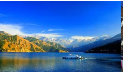
ล่องเรือทะเลสาบเทียนฉือ