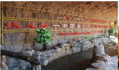
ระบบชลประทานอู๋หลู่ฟาน

พักที่ HAMPTON BY HILTON HOTEL โรงแรมระดับ 4 ดาวหรือเทียบเท่าในเมืองอู๋หลู่ฟาน