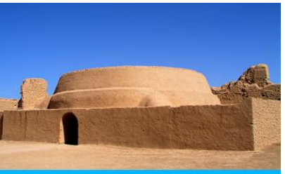
เมืองโบราณเกาซางอู๋เจี