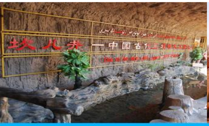
ระบบชลประทานอู๋หลู่ฟาน

ค่ำ รับประทานอาหารค่ำ ณ ภัตตาคาร พักที่ HAMPTON BY HILTON HOTEL โรงแรมระดับ 4 ดาวหรือเทียบเท่าในเมืองอู๋หลู่ฟาน