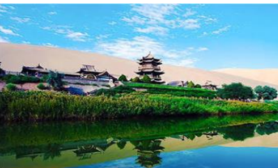
สระน้ำวพระจันทร์