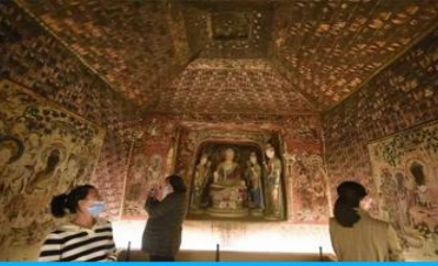
ชมภาพยนตร์ 3 มิติ