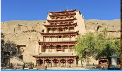
ถ้ำคินมัวเกา

พักที่ REZEN HOTEL ระดับ 4 ดาวท้องถิ่นหรือเทียบเท่าในเมือง เจียวกวน