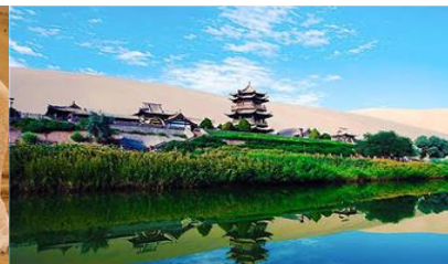
สระน้ำวพระจันทร์