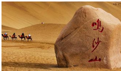
เนินทรายหมีงาช้าง

หลังอาหารให้ท่าน มีเวลาเดินเล่น ช้อปปิ้งใน ตลาดกลางคืน ซาโจว 沙洲夜市 ให้ท่านเลือกซื้อของที่ระลึกของเส้นทางสายไหมได้ตามอัธยาศัย