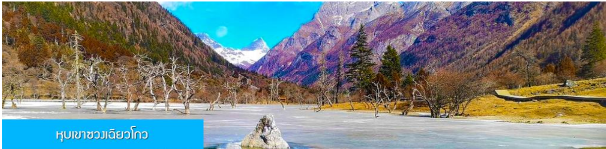
หุบเขาซวงเฉียวโกว

นำท่านเที่ยวชม หุบเขาซวงเฉียวโกว 双桥沟景区 ที่เป็นแหล่งท่องเที่ยวที่สวยงามที่สุดแห่งหนึ่งในเขตอุทยานภูเขาสีดรุณี นำท่านนั่งรถบัสของอุทยานที่วิ่งไปผ่านเส้นทางที่สร้างคู่ขนานกับลำธารภายในหุบเขา ท่านจะได้สัมผัสกับความสวยงามของทัศนียภาพธรรมชาติที่หาชมได้ยาก โดยมีภูเขาหิมะสูงตระหง่านอยู่เบื้องหลัง ธารน้ำใสไหลริน และสระน้ำที่มีสีเขียวมรกต ในฤดูใบไม้ผลิและฤดูร้อนท่านจะได้เห็นฝูงจามรีท่ามกลางทุ่งหญ้าเขียวขจี ส่วนในฤดูหนาวทุ่งหญ้าและพื้นดินจะปกคลุมด้วยพรมหิมะสีขาว.. รถบัสของอุทยาน