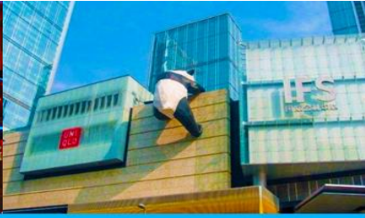
หมีแพนด้าปีนตึก ณ ตึก IFS