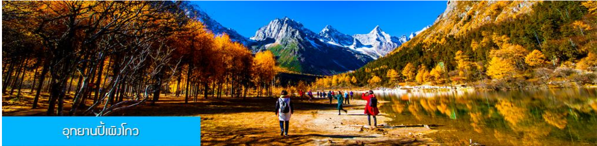
อุทยานปีเพ็งโกว