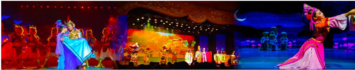
Romantic Show of Jiuzhai

หลังอาหารนำท่านสามารถเลือกซื้อรายการทัวร์เสริม พิเศษการแสดง ชุด Romantic Show of Jiuzhai เป็นการแสดงที่จัดขึ้นในโรงละครขนาดใหญ่ โดยการทุ่มทุนสร้างมหาศาล ทั้งเวที ฉากการแสดง ระบบ แสง สี เสียงที่ไฮเทค และทีมนักแสดงคัดสรรจากโรงเรียนนาฏศิลป์ เป็นการร้อยเรียงเรื่องราวของชนพื้นเมือง ประเพณีท้องถิ่น และเรื่องราว ตำนานในอดีต มาถ่ายทอดเป็นรูปแบบการแสดงที่อลังการละประทับใจ.....อัตราบัตรเข้าชม 400 หยวน หรือ 2,000 บาท/ท่าน หรือสอบถามรายละเอียดเพิ่มเติมได้ จากไกด์ท้องถิ่นหรือหัวหน้าทัวร์