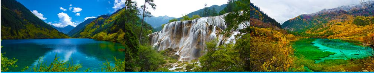
ทะเลสาบแรอ (RHINO LAKE)

ฤดูกาลผลิ ด้วยความสวยงามจึงทำให้อูทยานแห่งชาติจิวจ้ายโกว ได้ถูกขึ้นทะเบียนเป็นมรดกโลกทางธรรมชาติ ในปีค.ศ. 1992