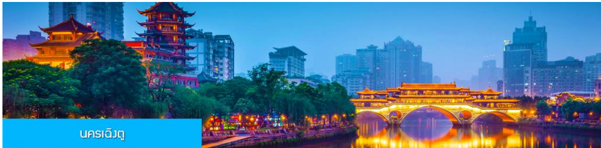
นครฉีจิงตุ