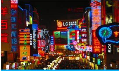
ถนนคนเดินชุนซู่