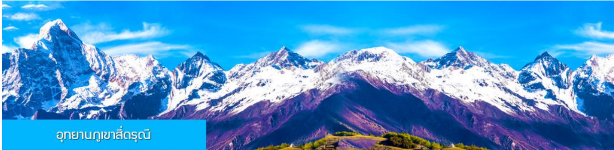
อุทยานภูเขาสีดรุณี