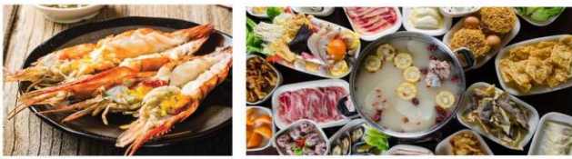
*ภาพที่ใช้เพื่อการโฆษณาเท่านั้น