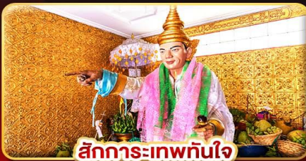
สิทธิการเทพทันใจ