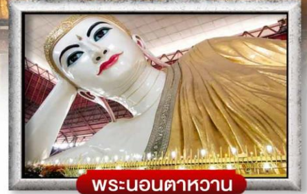
พระนอนตาหวาน

เมนู สดพิเศช!! กุ้งแม่น้ำเผาถ่านละ 1 ตัว ซาบูบุฟเฟต์สโตร์สเมียนมาร์