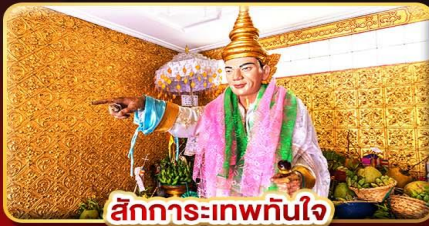
สิทธิการ-เทพทันใจ