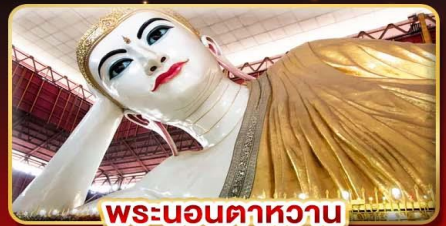
พระนอนตาหวาน