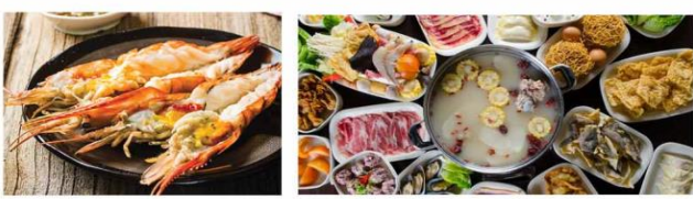
*ภาพที่ใช้เพื่อการโฆษณาเท่านั้น