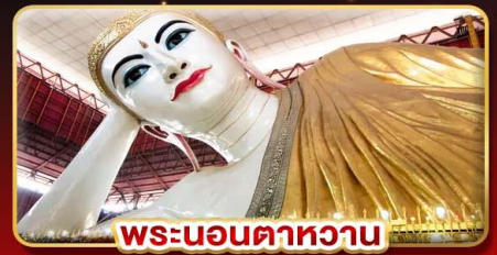
พระนอนตาหวาน