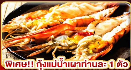
พิเศษ!! กุ้งแม่น้ำเผาทำนละ 1 ตัว