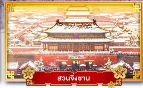
สวนจิงซาน