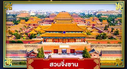
สวนจิงซาน