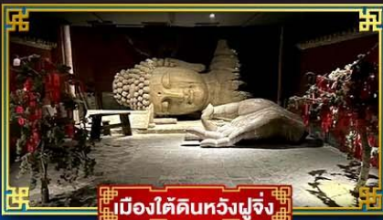
เมืองไคผิงหวงฟูจิง

“กำแพงหินลี่”...สิ่งมหัศจรรย์ของโลก พระราชวังต้องห้าม อดีตพระราชวังหลวงสุดยิ่งใหญ่