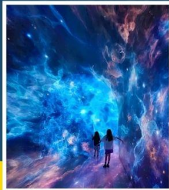
SPACE & TIME CUBE