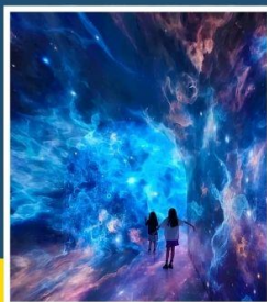
SPACE & TIME CUBE