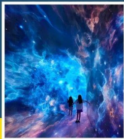
SPACE & TIME CUBE