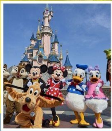
ดิสนีย์แลนด์