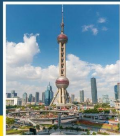
ชั้นชมหอไข่มุก