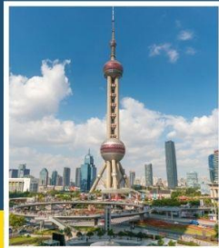
ไข่มุกหอไข่มุก