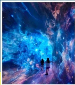
SPACE & TIME CUBE