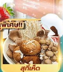
เมนูพิเศษ!!