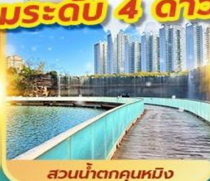
สวนน้ำตกคุณหมิง