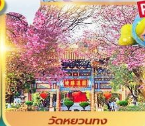
วัดหยวนทง