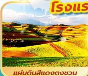
แผ่นดินสีแดงตงชวน