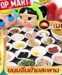
ขนมจีนข้ามสะพาน