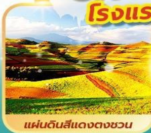
แผ่นดินสีแดงตงชวน