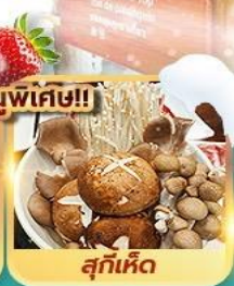
สุกี้เด็ด