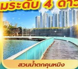
สวนน้ำตกคุณหมิง