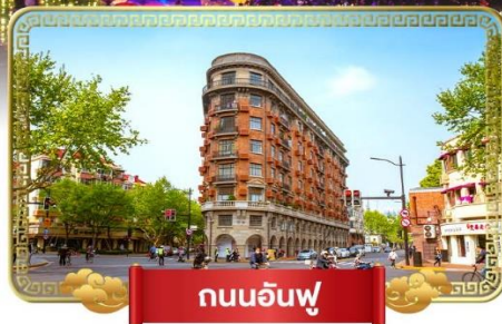
ถนนอันฟู่