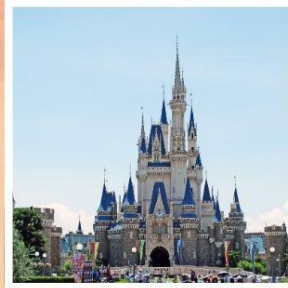
โตเกียว ดิสนีย์แลนด์