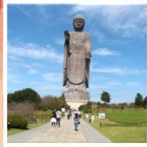
พระพุทธรูปอุซึคุโดบุทสึ