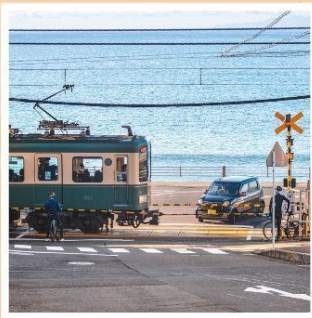
รถไฟเอโนะเด็ตสึ