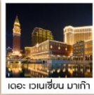
โอเอ: เวเนเซียน มาเก๊า

วัดนาริตะ / อีออน พลาซ่า / ฟูจิยามะ ทาวเวอร์ / โอฮิเมะ ฮักไก / สวนโอฮิชิ ปาร์ค / นังงะฟูจิโนะเด็น วัดฮาตาระ / วัดโคโตคุอิน / ซัปโปริงชินจูกุ / โตเกียว ดิสนีย์แลนด์ (รวมค่าบัตรเข้า) / พระพุทธรูปอูชิคุไดบุทสึ อามิ พรีเมียม เอาร์ทเล็ก / วัดเป่ากง / เซนาโดัสแควร์ / วัดอามา / เดอะเวเนเซียน / โอเอ: ลอนดอนเนอร์