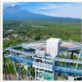
ฟูจิยามะ ทาวเวอร์