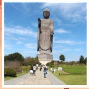
พระพุทธรูปอุชิคุโดบุทสึ