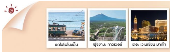
รถไฟเอโนะเด็น ญี่ปุ่น: ทาวเวอร์ เดอะ เวเนเชียน มาเก๊า

วันนาริตะ / อีออน พลาซ่า / ญี่ปุ่น: ทาวเวอร์ / โอชิโนะ ซักไก / สวนโออิชิ ปาร์ค / นั่งรถไฟเอโนะเด็น วัฒนาธรรม / วัดโคโตคุอิน / ซอปปิงชินจูกุ / โตเกียว ดิสนีย์แลนด์ (รวมค่าบัตรเข้า) / พระพุทธรูปอุชิคุไดบุทสึ อามิ พรีเมียม เอาร์ทีก / วัดเปากง / เซนาโต้สแควร์ / วัดอามา / เดอะเวเนเชียน / เดอะ ลอนดอนเนอร์