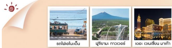
รถไฟเอโนะเด็น ฟูจิยามะ ทาวเวอร์ เดอะ เวเนเชียน มาเก๊า