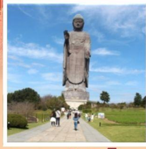
พระพุทธรูปอุซึคุไดบุทสึ