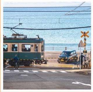
รถไฟเอโนะเด็ตสึ