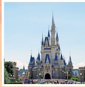
โตเกียว ดิสนีย์แลนด์