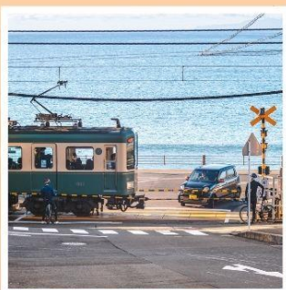
รถไฟเอโนะเด็ตสึ