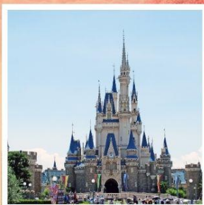
โตเกียว ดิสนีย์แลนด์