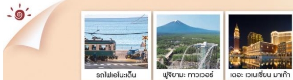
รถไฟเอโนะเด็น