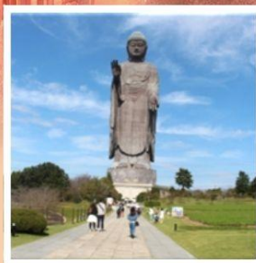
พระพุทธรูปอุชิคุโดบุทสึ