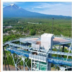
ฟูจิยามะ ทาวเวอร์