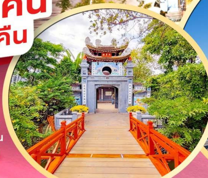
วัดหังอกเซิน