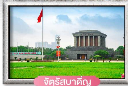
จัตุรัสบาตีย์