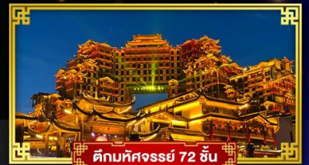
ตึกหิมะจอร์จ 72 ชั้น