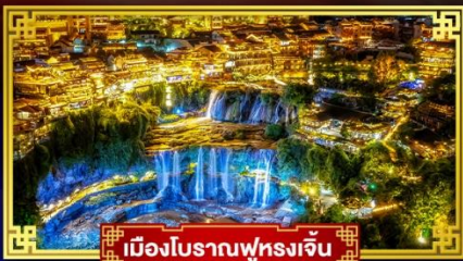
เมืองโบราณฟุรงเจิน

เที่ยว 2 เมืองโบราณ ตระกูลเมืองหิมะ "ICE & SNOW WORLD"