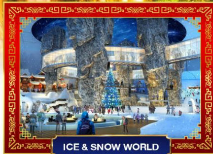
ICE & SNOW WORLD