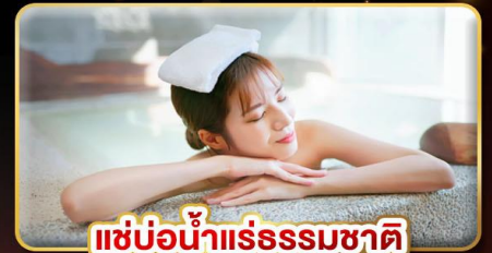
แช่น้ำแร่ธรรมชาติ