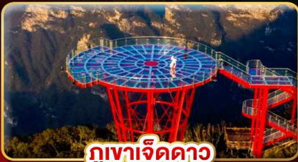
ภูเขาจิดดาว

หมู่บ้านโบราณริมน้ำตก "ฟุรงเจิน" สัมผัสเสน่ห์จางเจียเจีย มหัศจรรย์ทางธรรมชาติ