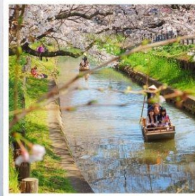
ศาลเจ้าอิคาะ