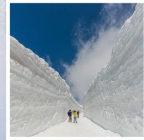
กำแพงหิมะ เจแปนแอลป์