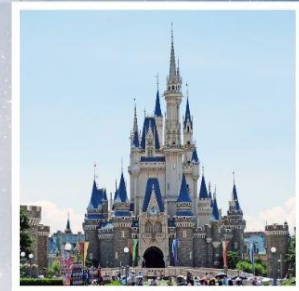
โตเกียว ดิสนีย์แลนด์