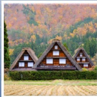
หมู่บ้านมรดกโลก ชิราคาวาโกะ