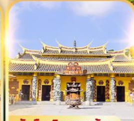
วัดฮิมเงินเทพเจ้า