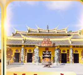
วัดซิมเงินเทพเจ้า