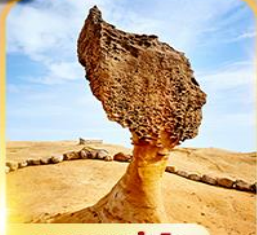
อุทยานเหย์หลิว