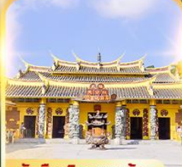
วัดฮิมเงินเทพเจ้า