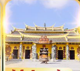
วัดซิมเจินเทพเจ้า