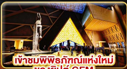
เข้าชมพิพิธภัณฑ์แห่งใหม่ ของยิปต์ GEM