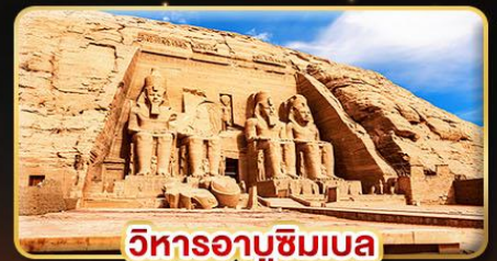
วิหารอาบูซิมเบล

น้ำหนักกระเป๋า 23Kg. (บินระหว่างประเทศ และบินภายใน)