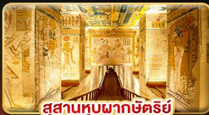
สุสานหุบผากษัตริย์