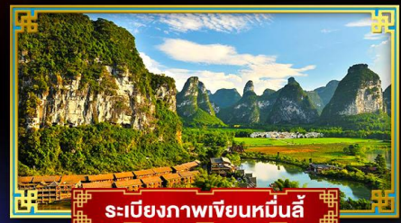
ระเบียงภาพเขียนหินถ้ำ