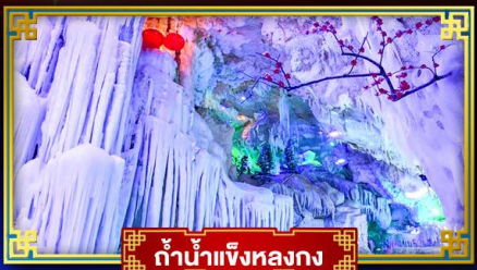
ถ้ำน้ำแข็งหลงกง

สุดอลังการ น้ำตก 2 พรมแดน แหล่งท่องเที่ยวระดับ 5A