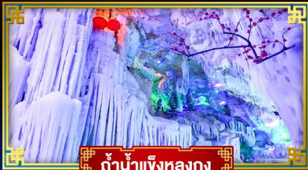
ถ้ำน้ำแข็งหลงกง

สุดอลังการ น้ำตก 2 พรมแดน แหล่งท่องเที่ยวระดับ 5A