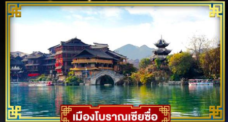
เมืองโบราณเซี่ยซือ