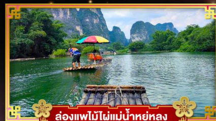
ล่องเรือไม้ไผ่แม่น้ำหยูหลง