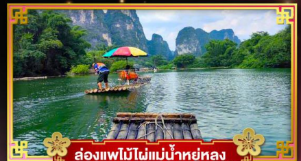
ล่องเรือไม้ไผ่แม่น้ำหยูหลง