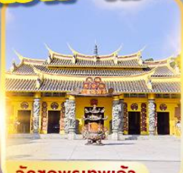
วัดชอพรเทพเจ้า