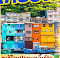
หมู่บ้านประมงเงินปิง