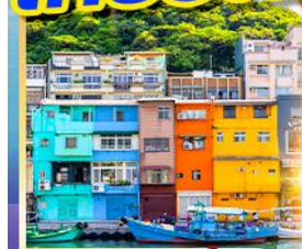
หมู่บ้านประมงเจินปิง

พักซีเหมินติง 2 คืน เที่ยวเต็ม!! ว่างวันอิสระ