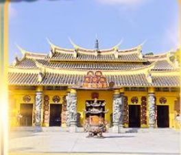
วัดชอพรเทพเจ้า