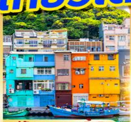
หมู่บ้านประมงเงินปิง

พักซีเหมินติง 2 คืน เที่ยวเต็ม!! ว่างวันอิสระ