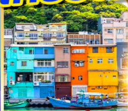
หมู่บ้านประมงเงินปิง